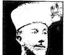
الحاج أمين الحسيني